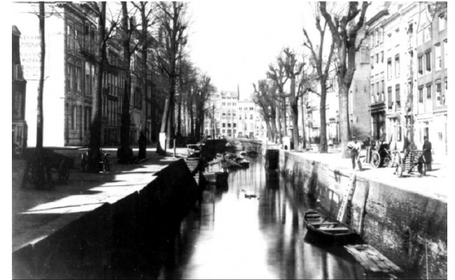
Bierhaven vanaf de Scheepmakershaven.